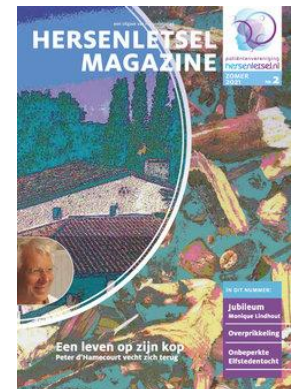
Hersenletsel Magazine zomer 2021

Speciaal voor leden met leesproblemen bevat het periodiek de rubriek 'Beeldspraak', waar de informatie 'afasievriendelijk' wordt aangeboden. Wie wel gesproken taal begrijpt, maar moeilijk kan lezen, kan 'Hersenletsel Magazine' als pdf opvragen om te beluisteren via computer of tablet met behulp van voorlees-software.