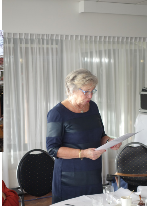
Kerstgedicht door Lineke Dijkstra