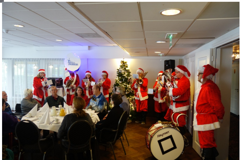
Fanfare Zaanse Zwabbers