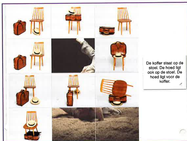
afbeelding 2 →